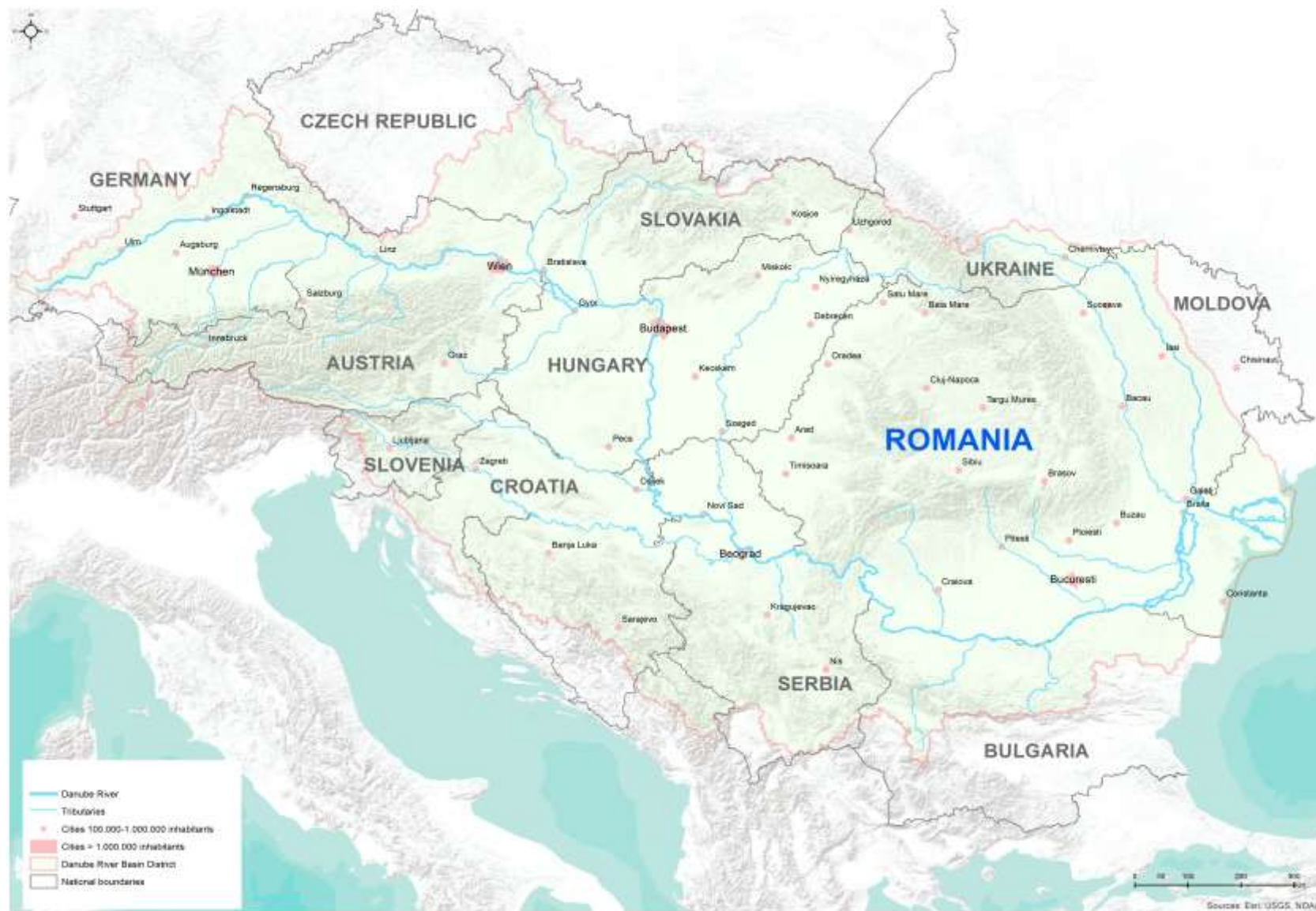
Figura 1.2. Districtul Hidrografic al Fluviului Dunăre